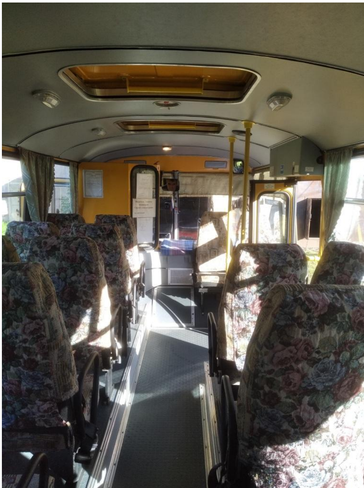
Обзорная фотография салона со стороны водителя